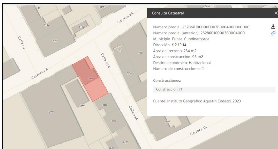
Ilustración 2. Ubicación de predio

C.P. 250020 Tel. +57(1) 823 40 70 823 40 71 / 823 40 73 Fax. +57(1) 825 76 20 Dir. Cra. 14 No. 13-05