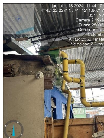
Ilustración 4. Canaletas y tubos