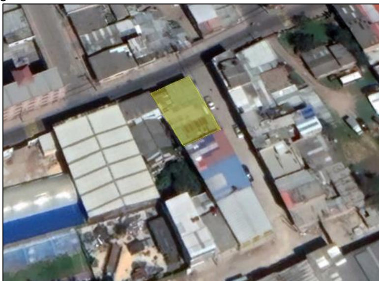
Ilustración 1. Ubicación de predio

Teniendo en cuenta que ante el municipio de Funza se interpuso queja por uso inadecuado del recurso hídrico, se realizó visita técnica ambiental, con el fin de inspeccionar la posible afectación del recurso hídrico, el día 18 de abril por parte del personal adscrito a la Secretaría de Ambiente y Bienestar Animal, de conformidad con el acta de visita ambiental No. 050, en el establecimiento comercial denominado “Auto lavado el Hato” ubicado en el barrio Hato (polígono amarillo), coordenadas 4°42'22.826" N 74°12'1.370" W, como se muestra en la siguiente ilustración: